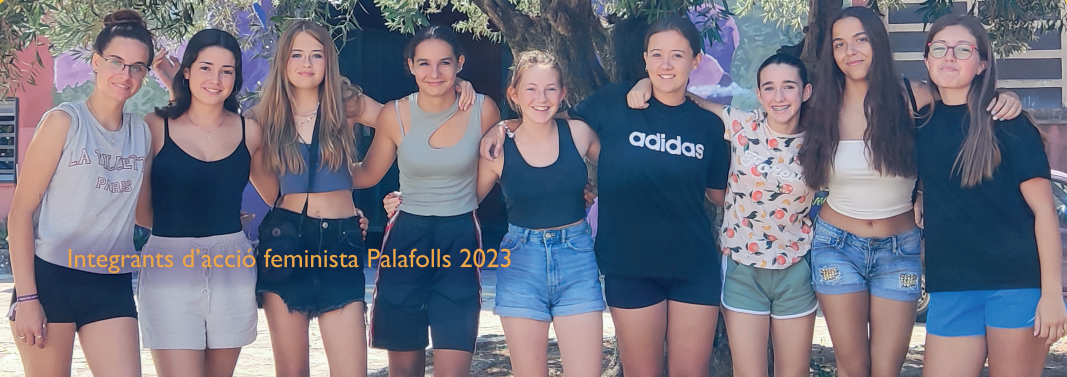
Integrants d’acció feminista Palafolls 2023

Palafolls compta durant tot l’any amb el grup d’Acció Feminista que treballa dia a dia per aconseguir un municipi lliure de violències cap a les dones i els col·lectius oprimits.